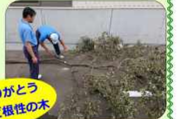
ありがとうございます 江南ど根性の木

先日の台風10号で倒れてしまった「ど根性大根」ならぬ「江南ど根性の木」コンクリートの隙間から根を伸ばし15~20年近く江南ラミネートと共に成長し、見守り続けてくれた守り神的な木。今日をもってお別れです。今までありがとうございましたm(_ _)m