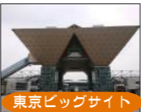
東京ビッグサイト

『第35回 国際文具・紙製品展ISOT』に四国中央市と市内の企業16社合同で「日本一の紙のまちブース」を設け出展。各企業を周遊できるレイアウトで来場者も多く国内外にたくさんPRできました♪わが社も3チームでリレーして3日間をやりきりました。大盛況で大変でしたが、それ以上に将来につながる有意義な時間となりました。参加させていただいたことに感謝です！