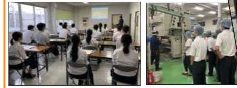
ヒートシール体験では、一人ひとりに本をプレゼント♪

【地域における体験学習】で総勢40名の三島高校2年生のみなさんが工場見学に来てくれました。紙産業のすばらしさをお伝えし、工場案内をしながらパンチ体験やヒートシール体験など織り交ぜて紙の魅力を体感してもらいました！自分の住む町に誇りをもつ一助になれば嬉しいです！